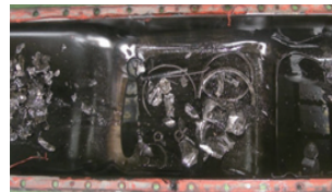
ピストンの破片など、異物が溜まったオイルパン。