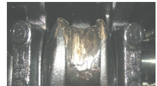
オイル劣化などで、フィルター不良で削れてしまったクランクシャフト。