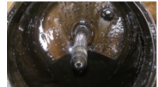
フィルターを突き抜けて異物とオイルが溜まったオイルフィルターケース。