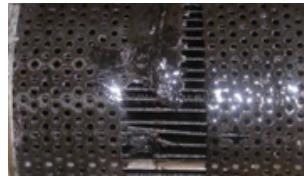
異物が多数入ってしまったオイルフィルター。