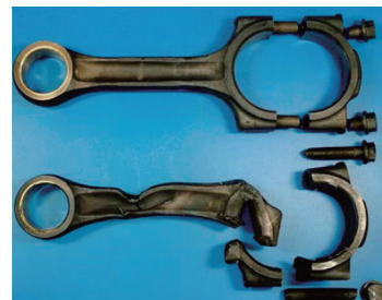
メタルが焼き付き破損したコンロッド